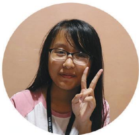
MINH THU SUMMER CAMP 2018

“The first time when I came to MK school, my level is only 3B. The score of reading, writing also speaking are really low and I’m kinda sad about it. But when I started studying at MK, all of my skills had been improved a lot. In my reading class, my reading skills are also improved of course. In my listening class, I also improved a lot because the listening lessons here is more difficult than that of in Vietnam. That’s why I always tried my